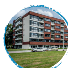
Oorden Staete Rotterdam