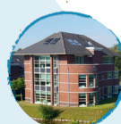
Centraal Bureau Barendrecht