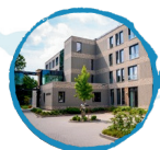
Amandelhof Capelle aan den IJssel