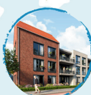
Oester Staete Yerseke