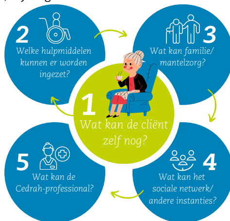
Onze Schijf van vijf

Cedrah werkt actief aan deze bewustwording, samen met partners in de keten en in de achterban. Ook het opleiden van medewerkers die intensieve dementiezorg geven op groepen en het opleiden van thuiszorgmedewerkers die intensieve zorg thuis geven is hard nodig. Tot slot passen we de gebouwen aan zodat passende zorg in alle woningen mogelijk is.